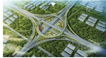
中轴大道与机场大道