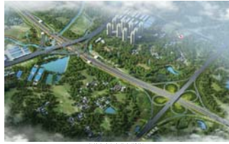
湘府东路东延(过桥)