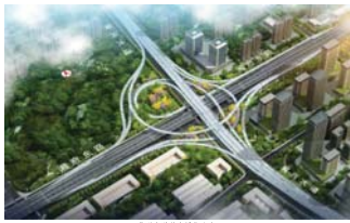
黄兴大道与中轴大道