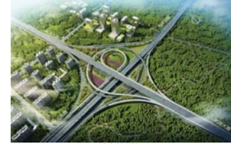
黄兴大道与中轴大道