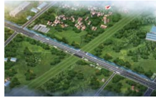
下穿长沙大道立交